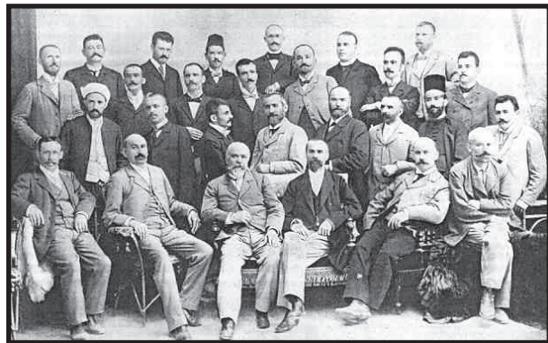
Nastavničko vijeće Velike gimnazije školske 1899./1900. godine: