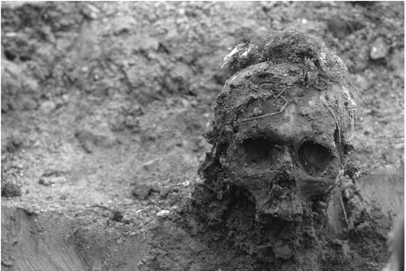
Kamenica kod Zvornika.