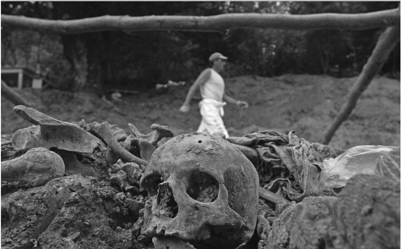
U selu Kamenica kod Zvornika pronađen je niz sekundarnih grobnica koje su krile ostatke žrtava srebreničkog genocida.

tijela i kao takvog ga mora cijeniti, kao svoje oko, mozak ili svoje ruke. I dušu i srce. Dušu, jer čovjek koji koristi aparat kao dio sebe, udahnuje atmosferu u sliku. I zaista je na rubu ezoterije da jedna ploha, jedna obična