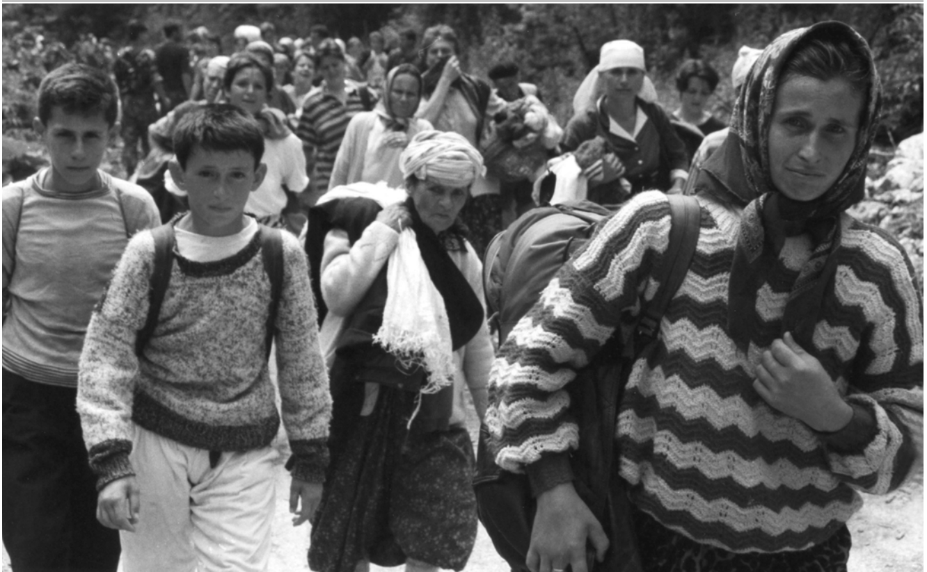
Ahmet Bajrić Blicko autor je serije fotografija koje dokumentuju dolazak preživjelih žrtava genocida iz Srebrenice u Tuzlu. Fotografije su nastale u periodu od 12. do 15. jula 1995. na današnjoj ruti "Marš mira" od Srebrenice do Nezuka.

Drugi je cilj organizacije međunarodna podrška profesionalnim foto-reporterima putem akademije "World Press Photo". Ona nastoji stimulirati