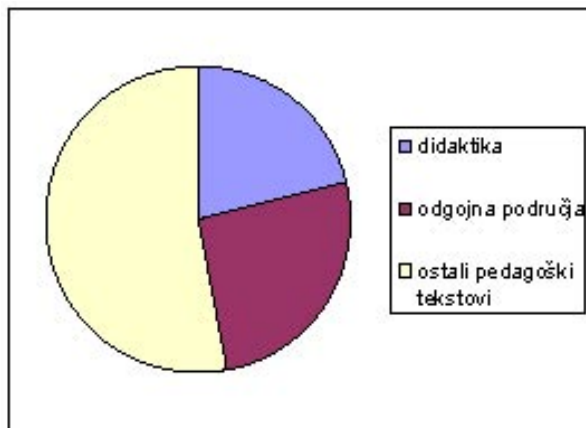
Grafički prikaz tekstova iz oblasti didaktike (20%), sa ostalim kategorijama

U prilogu ovoga poglavlja donosimo grafikon koji odražava strukturu tekstova iz područja didaktike u odnosu na ostale tekstove.