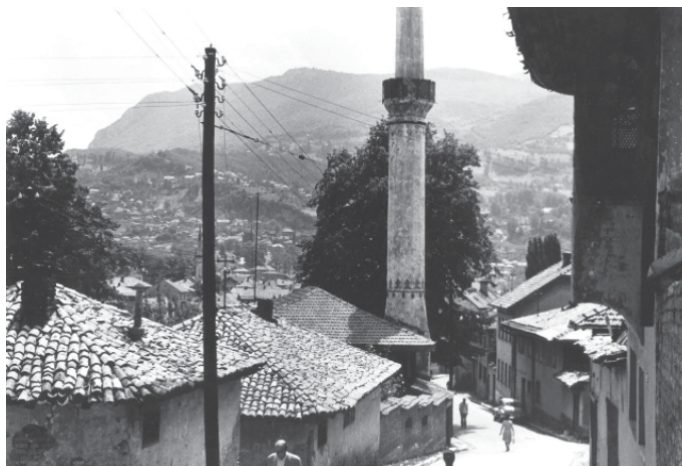
Sagrakči hadži Mahmudova džamija iz različitih perspektiva

to, kako piše Seid Traljić, da su u velikim gradovima u mektebima djecu podučavali muallimi uz pomoć kalfe, dok bi u mala sela dolazili putujući muallimi koji su po nekoliko mjeseci obučavali omladinu, ali i starije stanovnike, te bi nakon tih nekoliko mjeseci nastavili svoj put ka drugom selu, gdje bi ponovo djelovali kao narodni učitelji. Najčešće su to radili stariji učenici medresa koji su na taj način zarađivali novac za nastavak svog školovanja. (Traljić, 1939-40:38)