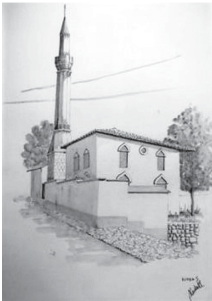
Sagrački hadži Mahmudova džamija (Ulomljenica) (Kudra, 2006:45)

uputili 1706. godine, devet godina nakon proboja Savojskog u grad, navedena su čak 32 uništena i zapaljena mekteba. Jedan od njih je i mekteb Sagrački hadži Mahmuda. U molbi je tražena pomoć da se uništene mektebi poprave, i da se pri tome osnuje glavica za isplaćivanje muallima, jer su nakon spaljivanja džamija ostali bez prihoda. U tom periodu muallim Sagrački hadži Mahmudovog mekteba je bio muallim Husamuddin. (Kasumović, 1992:159) Mehmed Handžić piše o ovoj molbi i o dva popisa nastradalih mekteba koje stanovnici Sarajeva šalju u Istanbul i mole Portu da odredi potrebnu pomoć kako bi se ovi nastradali mektebi obnovili. U popisu su spomenuti svi tadašnji muallimi, čime popis dobiva još veću vrijednost. Popisi su bili na turskom jeziku, a Handžić ih je bez ikakvih izmjena i intervencija preveo na bosanski jezik. (Handžić, 1942-43:120-121)