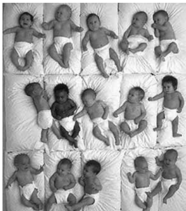
Slika 1. Spontanitet i samoaktivitet primjetni su od samog rođenja. Novorođenčad se razlikuju po svojoj gotovosti za kretanje i po ležanju, po energiji i živahnosti. 3

razvojem. Izuzetno je velik broj znakova koji rezultiraju iz dječijeg spontanog ponašanja i samoaktiviteta. Te znakove ispoljava svako novorođenče. Novorođenčad se razlikuju po plaču, po načinu sisanja, po reagiranju na iznenadne draži, različito reaguju na frustraciju pri hranjenju i kupanju, razlikuju se u pružanju protesta i otpora, različito reagiraju na draži ometanja i suprotstavljanja itd. Novorođenče je programirano za čitav repertoar različitih reakcija i znakova.