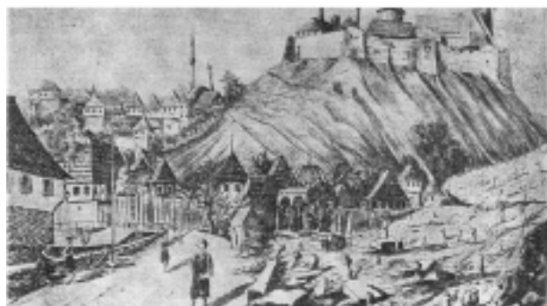
Travnik - srednjovjekovni grad, te mahale Varoš i Šumeće u podgrađu, crtež iz devete decenije prošlog stoljeća. Na vrhu crteža vidi se dio džamije u tvrđavi. (Asboth, Bosnien und die Herzegowina , 1888)

Travnik: Premda se u izvorima javlja relativno kasno, Travnik spada u red mjesta u kojima je veoma rano sagrađena džamija, time i uspostavljena imamska i hatibska služba. Prva džamija u Travniku nosi ime sultana Mehmeda, znači da je nastala prije 1480. godine. Kako je nastala u tvrđavi tako je predstavljala i džamiju namijenjenu za posadu, o kojoj pisanih tragova nemamo do 1516. godine tako da i prve konkretne vijesti o imamu potječu od tada. Prvi poznati imam i hatib u travničkoj tvrđavi i samom Travniku uopće bio je mevlana Uveys. Od 14 poznatih imama Bosanskog sandžaka, travnički je uživao najveći timar od 2000 akči, kojem je pripadalo selo Moščanica u susjednoj nahiji Brod. Između 1530.-1540. g. smjenjivali su se mevlana Hasan i Alija-fakih po dva puta. Visina timara ranije određena nije dokidana, ali su posjedi tih godina bili znatno bliže mjestu službovanja, u selima Gladnik i Putičevo u nahiji Lašvi, u neposrednoj blizini Travnika.