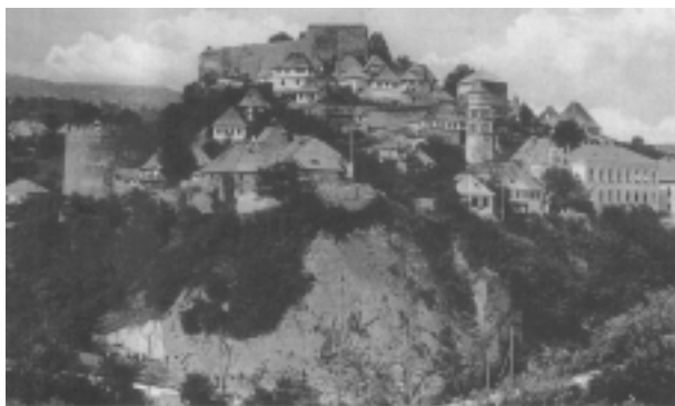
Jajce početkom 20. stoljeća