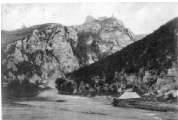
Ostaci tvrđave Boćac, na vrhu stijene

Boćac: Prvu posadu Boćca, koja se u izvorima javlja od 1530. g., činili su graničari-ulufedžije među njima i imam. Do 26. ramazana 946