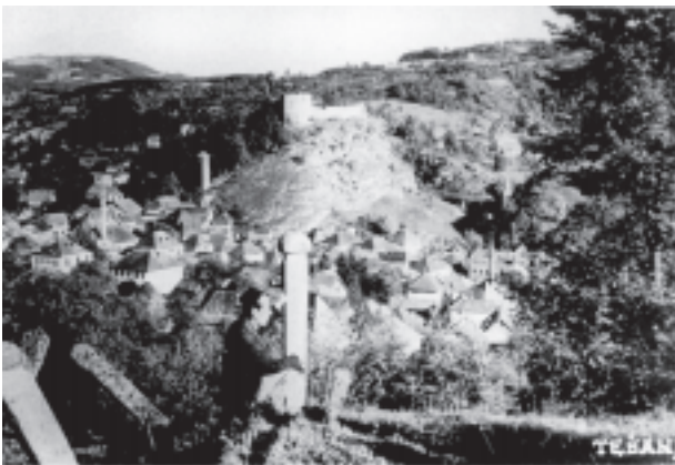
Ostaci tešanijske tvrđave u drugoj polovini 19. i početkom 20. vijeka

Tešanj: Približno u isto vrijeme kada se to dogodilo u Doboju nastala je džamija u tvrđavi Tešanj. Vjerovatno je već tada u njemu postojala i posada o kojoj pisane tragove srećemo 1530. godine. U to vrijeme ona je isplaćivana u novčanim iznosima do 1540. godine. Prvi poznati imam u Tešnju tih godina bio je Mustafa, čije približno vrijeme stupanja niti prestanka službe nije poznato.