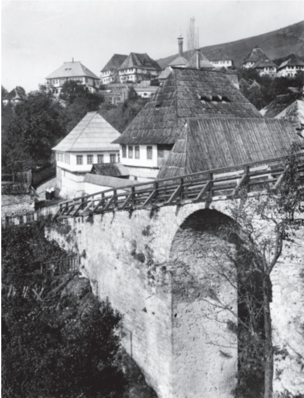
Prilaz travničkoj tvrđavi