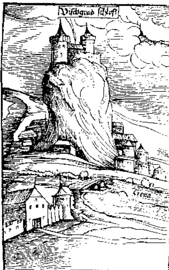
Tvrđava Višegrad, gravura iz Kuripešićevog putopisa 1531.

Višegrad: Prvi pisani tragovi o postojanju imamske službe u Višegradu datiraju iz 1468/9. godine, kada ju je obavljao mevlana Muhamed. Prihodi kojima je raspolaagao u selima Gornj Velji Lug (nahija Višegrad) i nenaseljena mezra Bukovik, (nahija Brodar) iznosili su 2048 akči. Ovako visok timar nije ostao dugo i već od 1485.g. Musa, imam višegradske tvrđave, dobijao je 1510 akči u drugim selima, Srednja Loznica i Zametice, u nahiji Višegrad. Nije poznato do kada je ostao na toj dužnosti ali je to bilo do poslije 1489. godine. Od 1516. kao imam službovao je Mehmed sa 1605 akči, u Srednjoj Loznici i Oramenici. Služba u ovoj tvrđavi trajala mu je prilično dugo, do 1540. godine, kada ga je naslijedio Muslihudin.